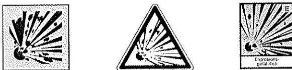
(schwarze, detonierende Bombe auf orange-gelben Untergrund)

Behältnisse müssen außen mit dem Gefahrensymbol nach § 14 Abs. 1 Nr. 5 der 1. Verordnung zum Sprengstoffgesetz